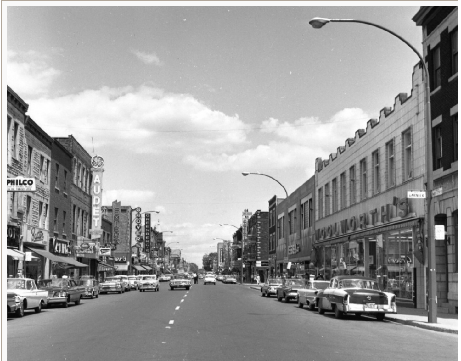
La situation en 1961.

La photographie suivante nous montre l'avenue du Mont-Royal en 1961. Les constructions ont repris la place qui leur revient et le tissu commercial de l'avenue est maintenant complété. On voit le magasin L.N. Messier et le 5-10-15 Woolworth's qui occupent maintenant l'espace. On voit que leur architecture exprime de façon évidente le courant d'une autre époque en affichant un style nettement plus moderniste et un brin Art déco. Le temps a passé et le style architectural a changé. On ne fait plus de façades en pierres calcaires et on utilise maintenant des éléments de béton décoratifs et aussi des modules de blocs en terracotta vernissés (dans le cas du Woolworth's). Nous sommes en plein milieu de l'âge d'or de l'avenue du Mont-Royal, qui est maintenant la destination non seulement des résidents du quartier, mais aussi celle de nombreux Montréalais qui viennent chercher un « goût du jour » qui vient d'arriver sur Mont-Royal, avant d'apparaître plus tard ailleurs.