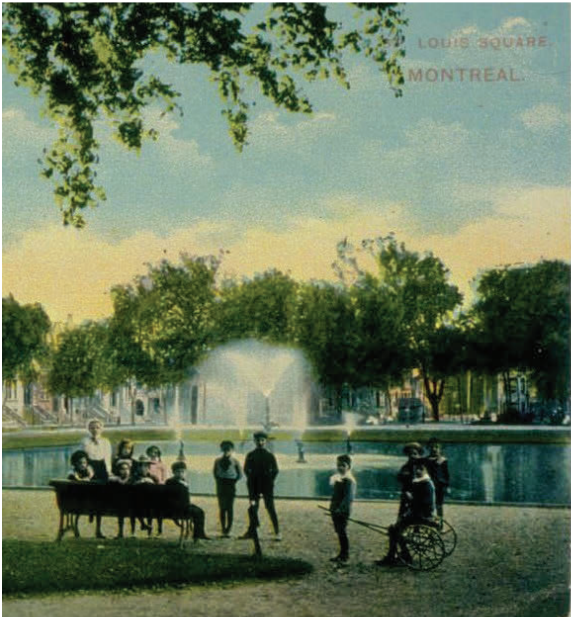
Groupe d'enfants devant la fontaine du Carré Saint-Louis, 1910.