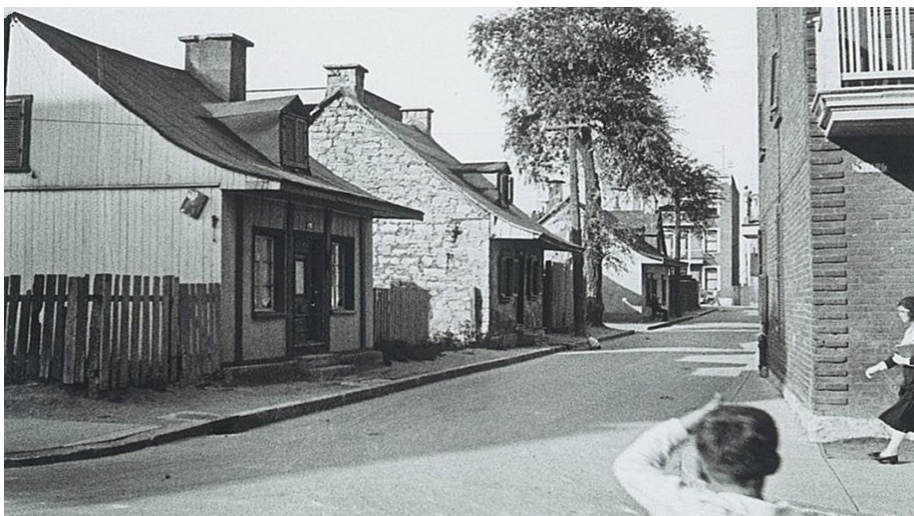
Petites maisons ouvrières de la rue Lagarde, dans le secteur de Coteau Saint-Louis.