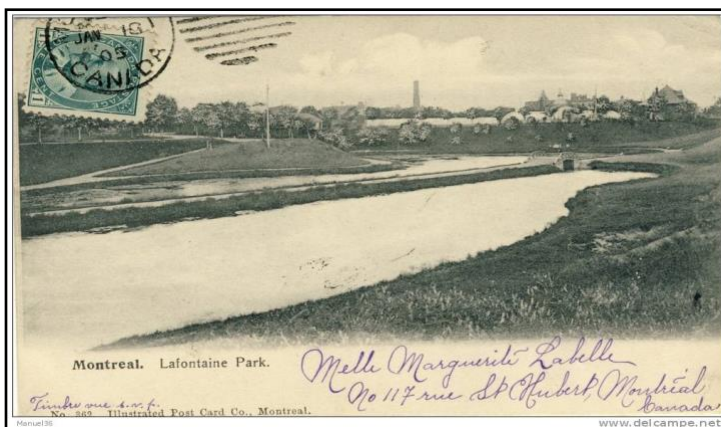
Les étangs du parc La Fontaine avec en arrière-plan, les serres. Vers 1910. Source : www.delcampe.net -#273-001