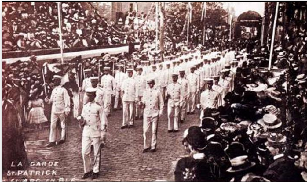
Congrès eucharistique de 1910 Carte postale tirée du site Internet

Le site accessible au www.histoireplateau.org constitue une porte d'entrée appréciable tant dans son contenu que dans son contenant. Il offre un accès à :