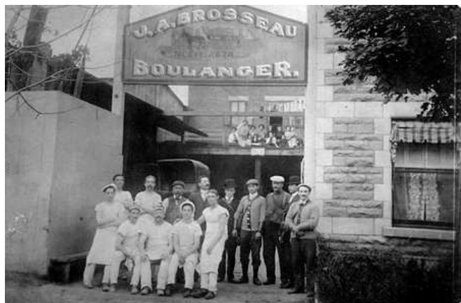
Boulangerie J.A. Brosseau, rue Boyer, 1910.

Le blogue, présentant la petite histoire quotidienne du quartier, poursuit son existence comme site autonome et aussi comme partie du site Internet de notre société.