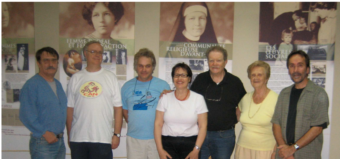
Les membres du Conseil d'administration 2007 (photo juin 2007)