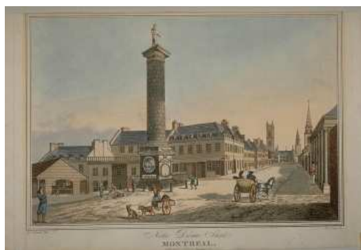
Illustration de la rue Notre-Dame dans le vieux Montréal en 1830. Ce cadre a été retrouvé à travers la collection de livres et documents héritée de la Ville de Montréal par la SHGP.